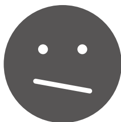
52% DE LAS PERSONAS SE SIENTEN PREOCUPADAS

Esta respuesta permite identificar que hay pleno conocimiento de la identificación de la problemática, sus impactos y la amenaza sobre los medios de subsistencia (agua, alimento, saneamiento, etc.).