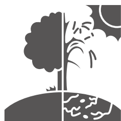
100% CONOCEN QUÉ ES EL CAMBIO CLIMÁTICO