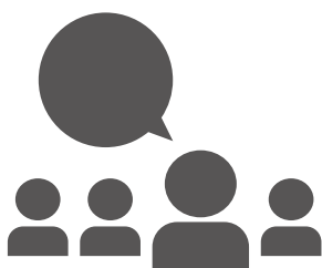
RANGO ETARIO 14 a 17 años

Al indagar sobre el grado de conocimiento en relación a la problemática del cambio climático, el 100% de las personas consultadas respondió que escucharon hablar y/o que conocen qué es el cambio climático .